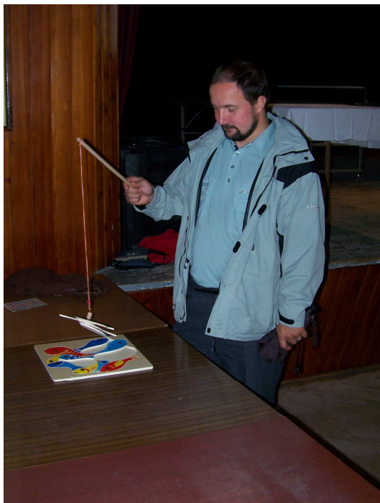
Nejen pro děti předškolního věku byla připravena spousta her a soutěží.