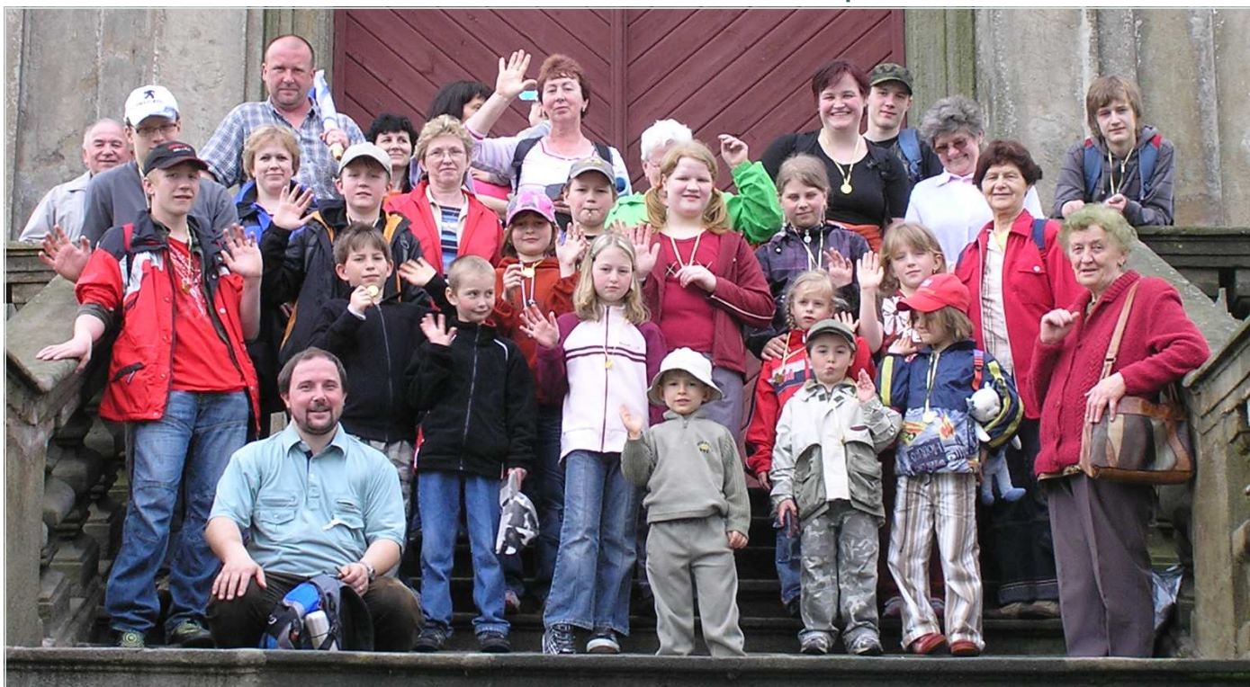
Farní výlet dětí na Horu Matky Boží v Králíkách