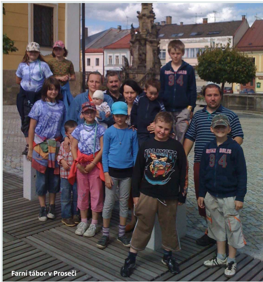
Farní tábor v Proseči