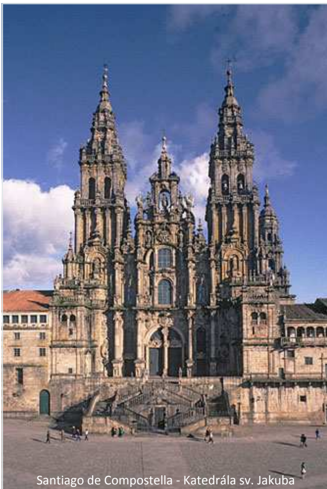
Santiago de Compostella - Katedrála sv. Jakuba