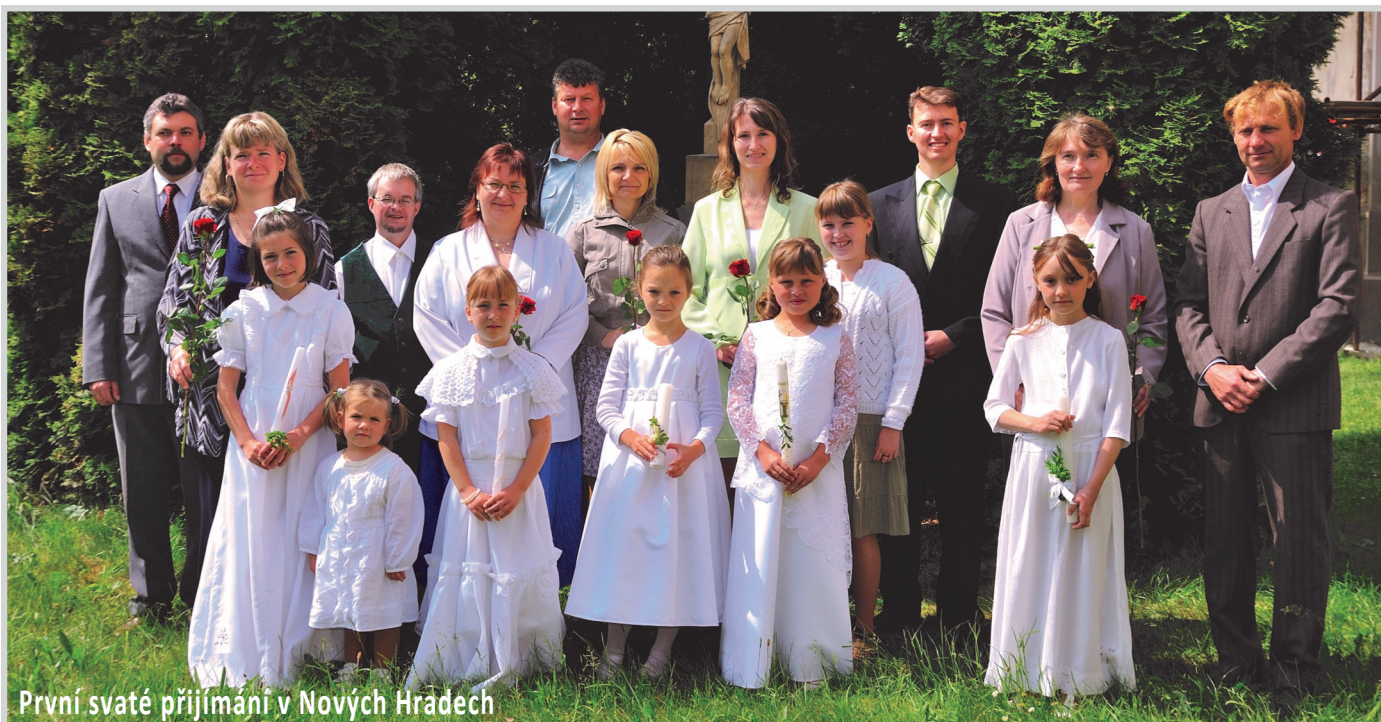
První svaté přijímání v Nových Hradech