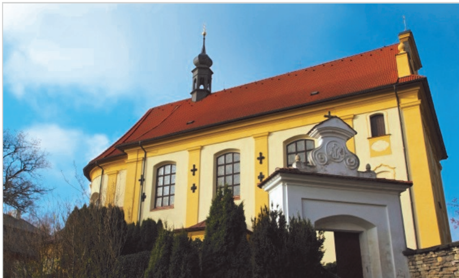
• Opravený kostel v Nových Hradech •

V době od 2. - 9. února bude P. Zdeněk Mach na dovolené.