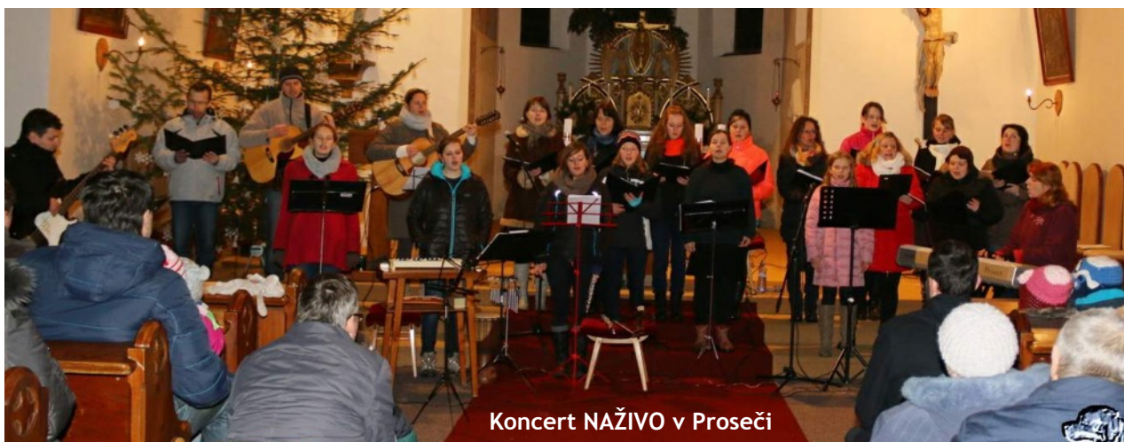
Koncert NAŽIVO v Proseči