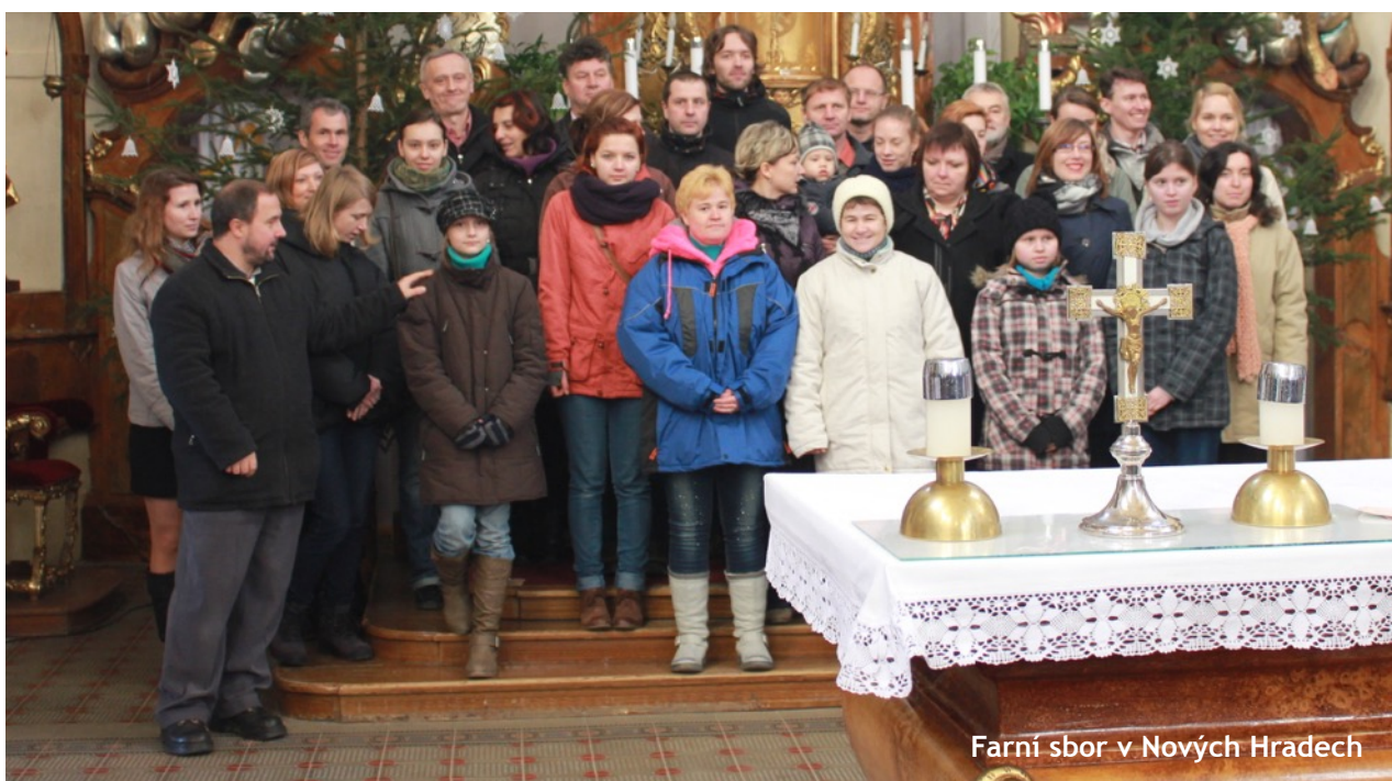
Farní sbor v Nových Hradech