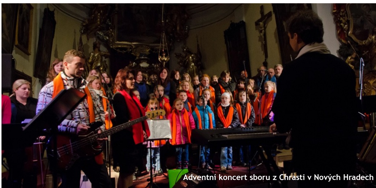
Adventní koncert sboru z Chrasti v Nových Hradech