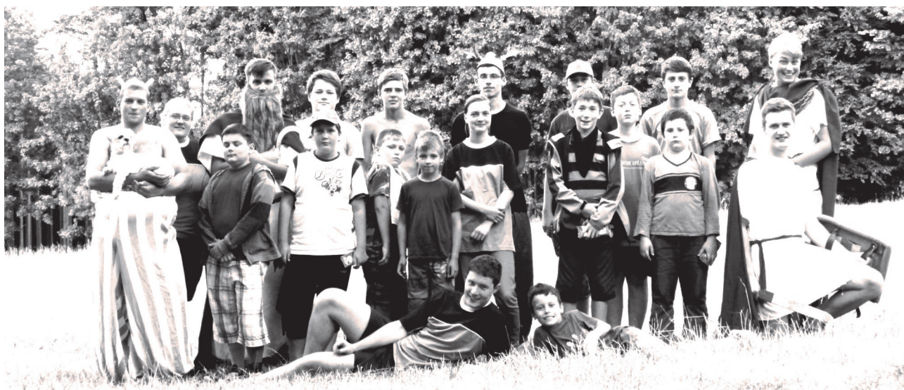
Ministrantský tábor 2015 na Pasekách

ŘÍMSKOKATOLICKÁ FARNOST PROSEČ společně se SKAUTY