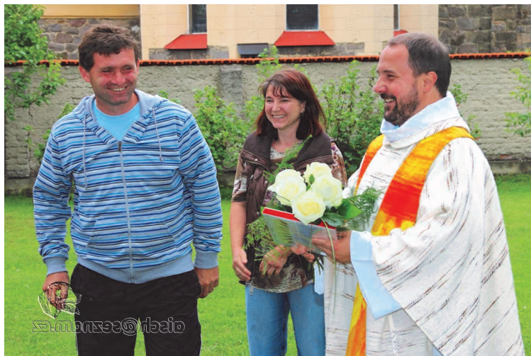
Zakončení školního roku táborákem v Proseči

Nové Hrady: 16 - 18 svátost smíření, adorace