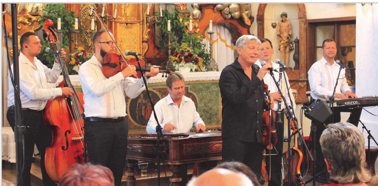
Koncert skupiny Hradišťan v Nových Hradech