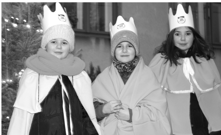
Tříkrálová sbírka v Příluce

Proseč: 17 - 19 svátost smíření, adorace