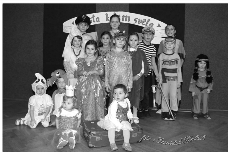
Děti z Misijního klubka