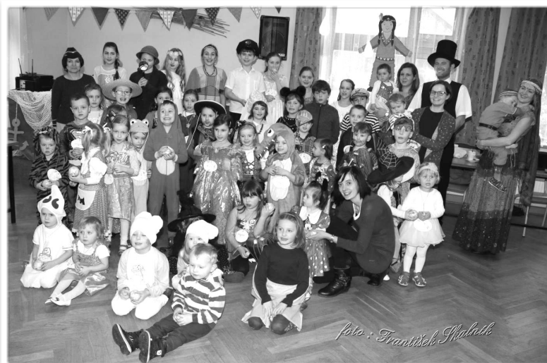
Misijní karneval v Perálci