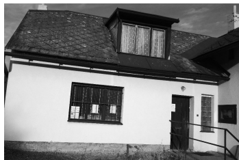
OCH Nové Hradky