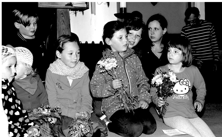
Misijní klubko Proseč

Zatímco děvčata zkoušela tanec na Noc kostelů, kluci pro ně chystali cestu značenou fábrovky a lístečky s úkoly. Cesta je dovedla ke Skalníkom na zahradu, kde společně prožily chvíle ve společenství věřících dětí, zpestřené fotbalem, skákáním na trampolině apod.