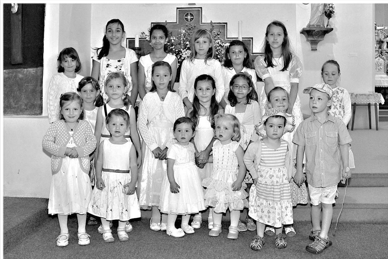
Slavnost Božího Těla v Proseči