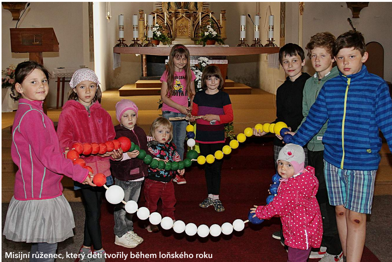
Misijní růženec, který děti tvořily během loňského roku