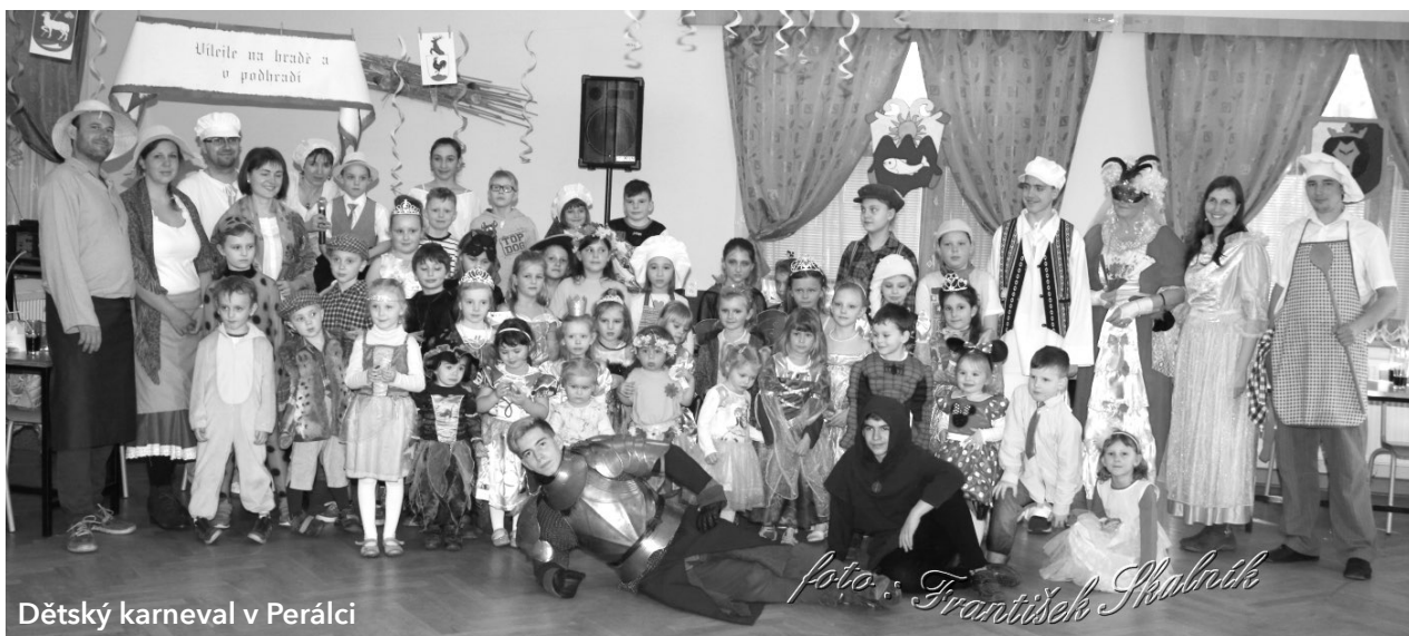
Dětský karneval v Perálci