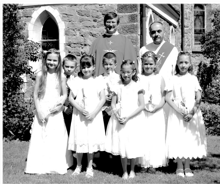
První svaté přijímání v Proseči

Dalším svátkem je svátek Nejsvětějšího Srdce Ježíšova, který církev