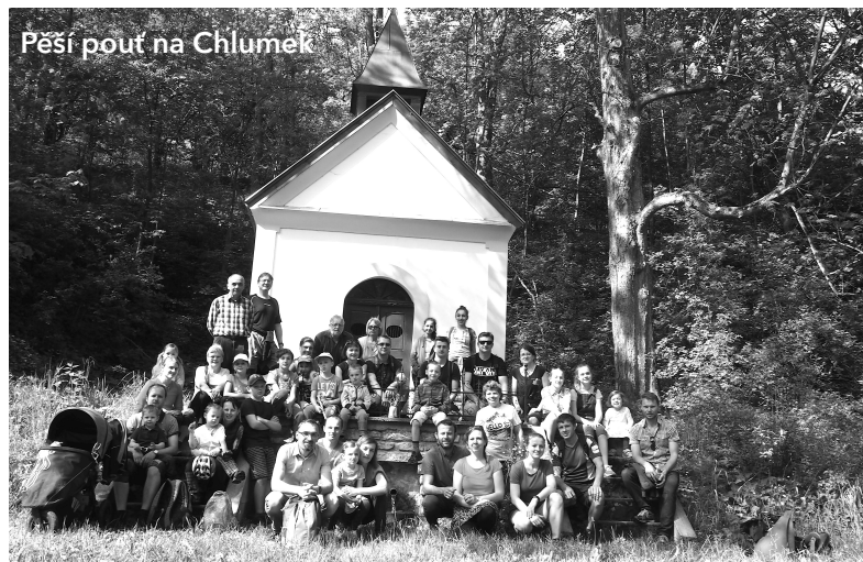
Pěší pouť na Chlumek