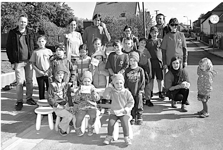
Pod jednou střechou