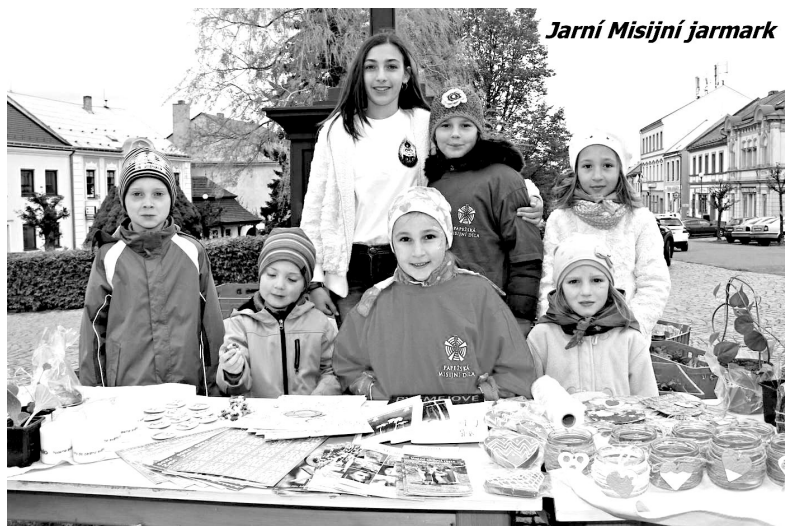
Jarní Misijní jarmark