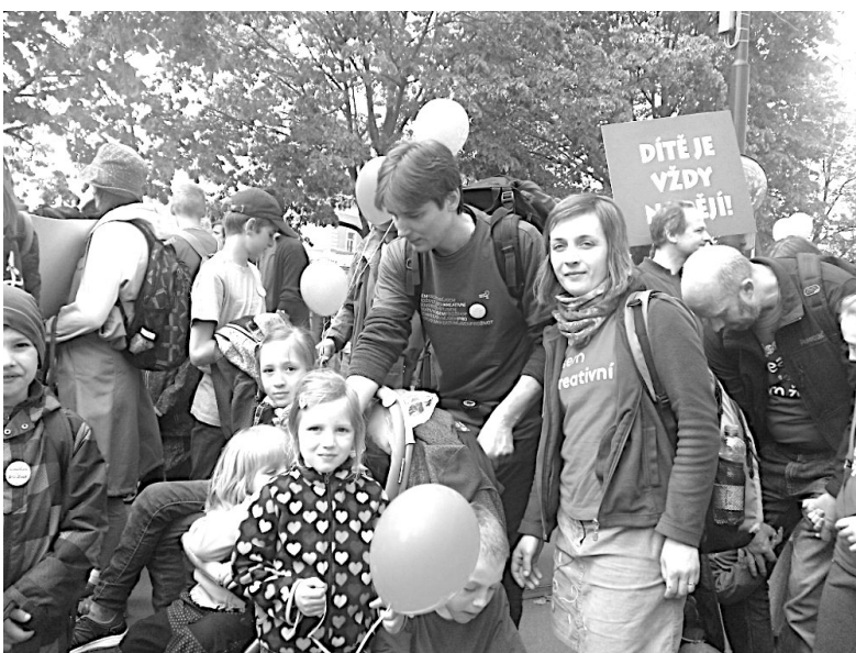
Pochod pro život a rodinu