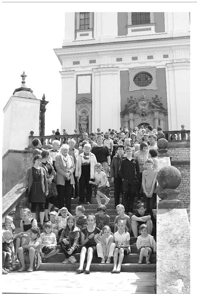
Pěší pouť na Chlumeck