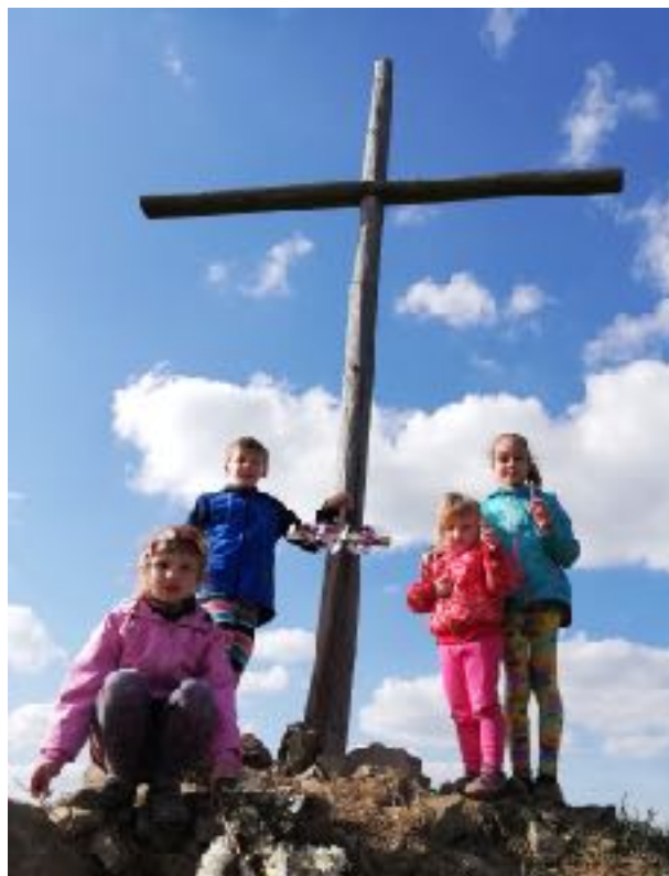
Fotografie k článku "Bůh v naší rodině" str. 2