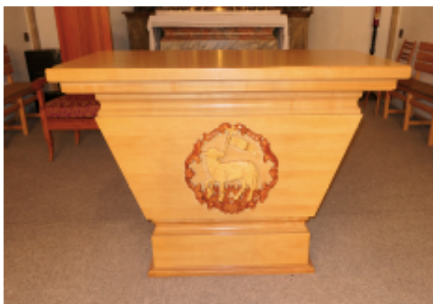
22. 10. 2006 svěcení obětního stolu