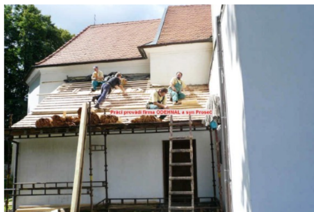
2007 výměna střešní krytiny